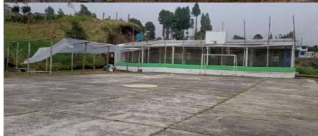
SEDE SAN ANTONIO