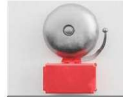
Instalación de un timbre